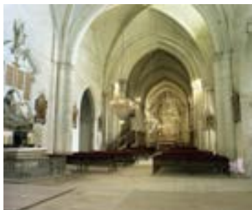
Nef de l'église Saint-Laon