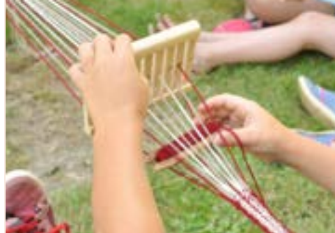
Atelier de tissage par Arkéo Fabrik