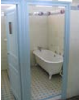
Cabine de bain et faïences Art Déco